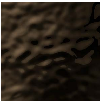
Testa di moro Dark brown