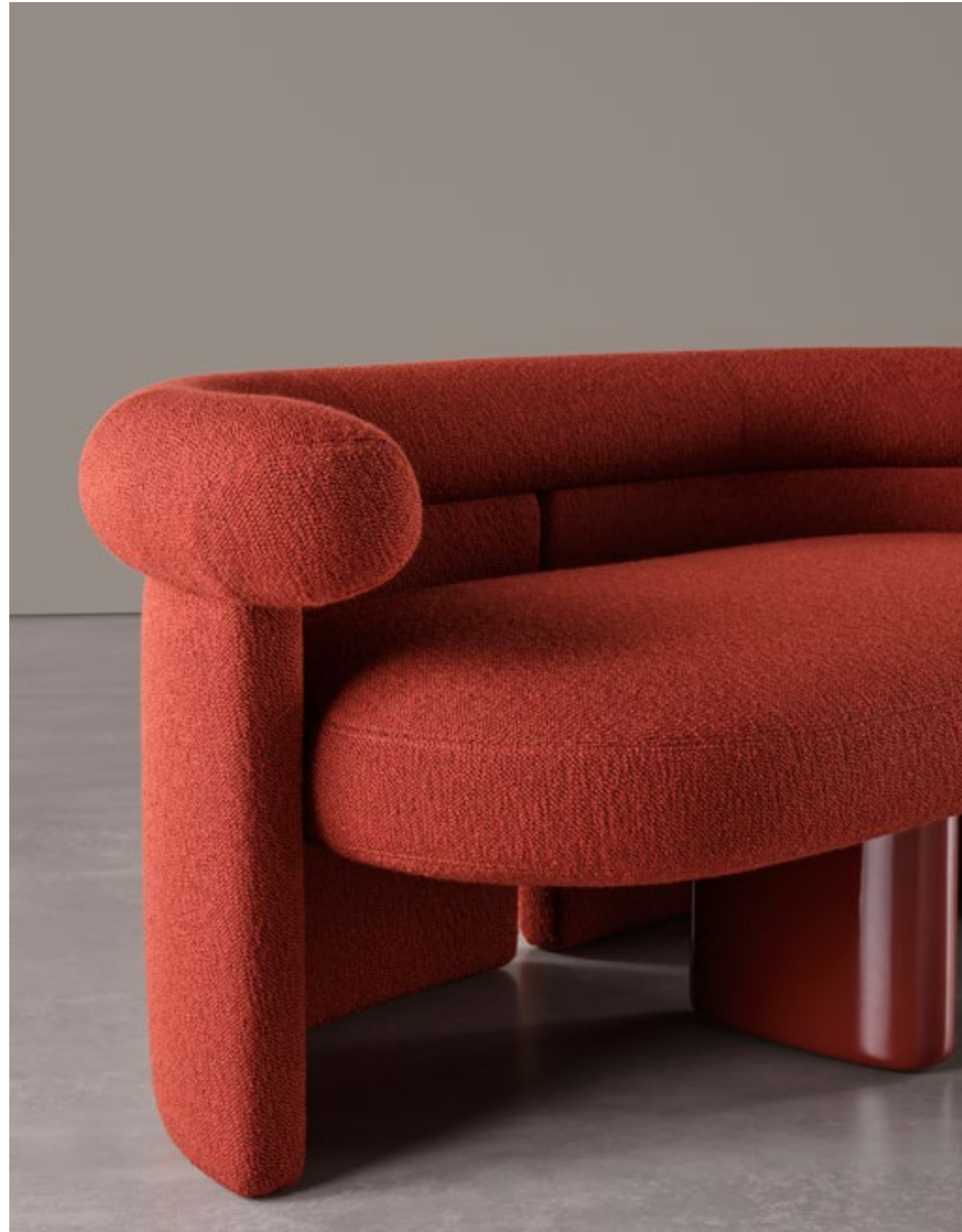
poltrona - armchair